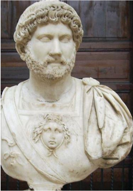
Publio Anneo Floro